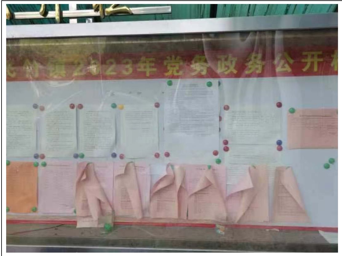
图 2.2-2 第一次环评信息现场公示

建设单位在项目所在地飞竹镇公告栏醒目处张贴该项目的公告，公示时间为 2022 年 12 月 7 日至 2022 年 2 月 20 日。