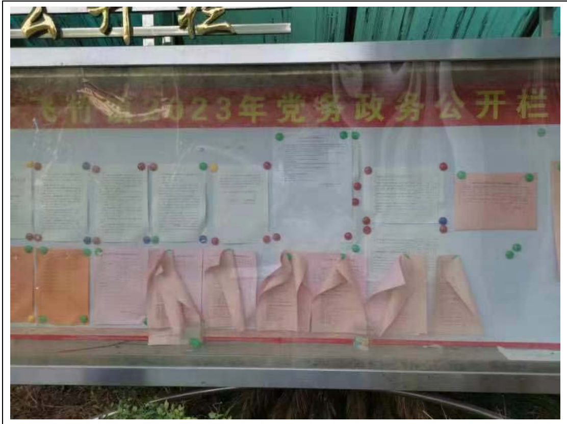
图 3.2-3 第二次环评信息现场公示

建设单位在项目所在地飞竹镇公告栏醒目处张贴该项目的公告，公示时间为 2023 年 5 月 17 日至 2023 年 5 月 30 日。