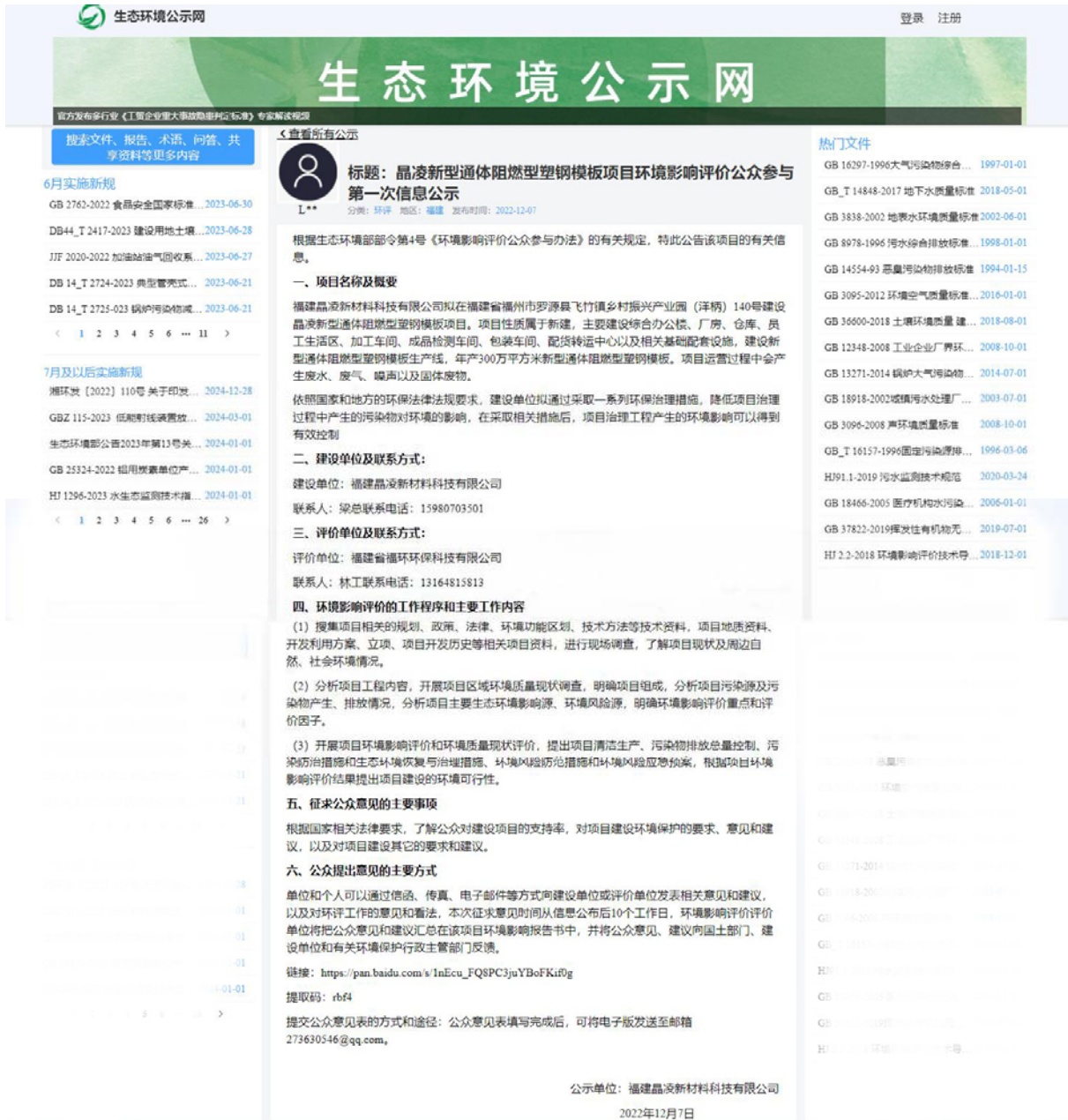
图 2.2-1 第一次网络公示截图