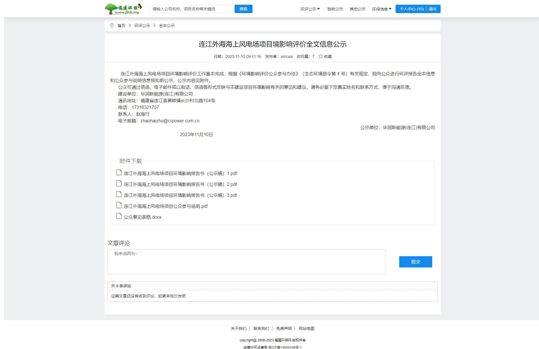
图 6.2-1 公示网页截图

我司根据厦门中集信检测技术有限公司编制的环境影响报告全本，于 2023 年 11 月 10 日在福建环保网网站（ http://www.fjhb.org/ ）发布环境影响报告书全本及公众参与说明公示，公示情况见图 6.2-1。