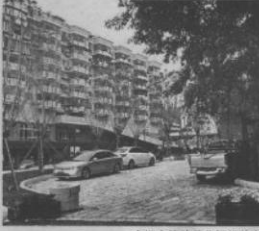
广场内停放着几辆机动车

洪山社区多次介入协调,并尝试设置隔离石墩,但遭到汽修店阻挠。洪山镇城建办工作人员表示,由于广场部分区域在小区红线范围内,无法强制要求店面整改。