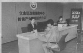
窗口服务区内,工作人员为企业员工办理业务

海都记者 李惠琪 通讯员 仓翼 “以前我办理各种业务的时候,因为办事处有点远,加上对办事流程不熟悉,跑来跑去还办不好。现在咨询更方便了,还可以咨询问题,既省了时间,又提高了效率,为你们的代办服务点赞!”10月26日,林女士来福州仓山区智能产业园园区代办公点,在代办服务人员的帮助下很快办理了所需业务。