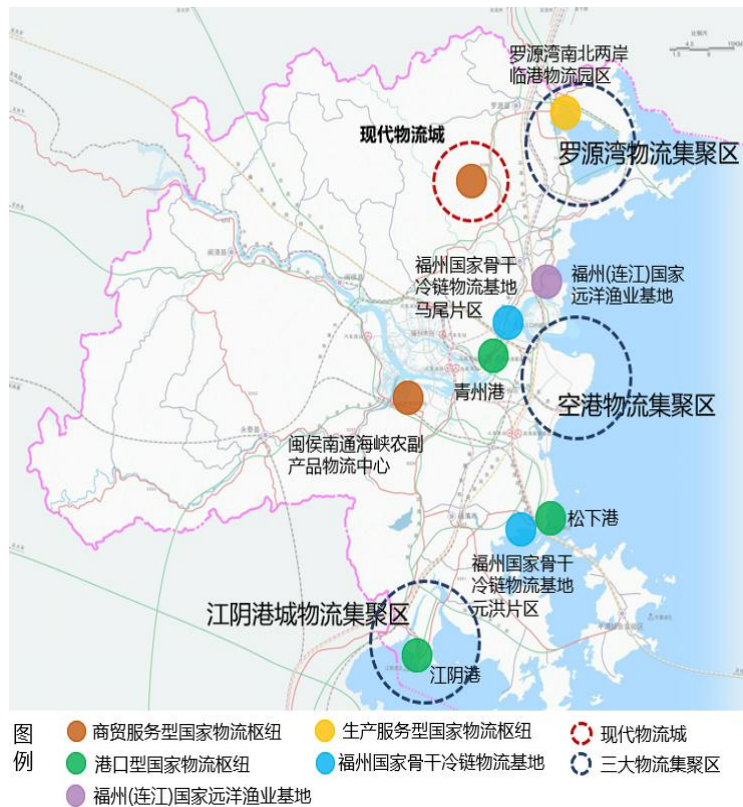
图 2 福州物流空间布局示意图